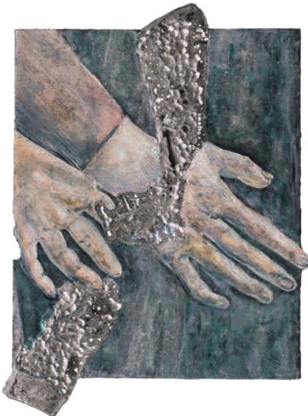
Fig. 2 Image en négatif tourné de 90° de Legenda Aurea Inversa (VII, fragment 3), 2023, d'Anri Sala