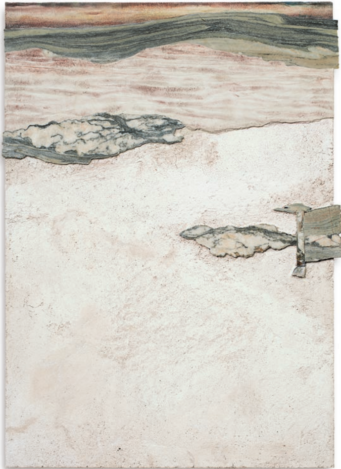
Surface to Air XIII (Cipollino/Quasi pietra) , 2023 peinture à fresque, intonaco sur aerolam, marbre Cipollino, 100 × 72 × 5 cm