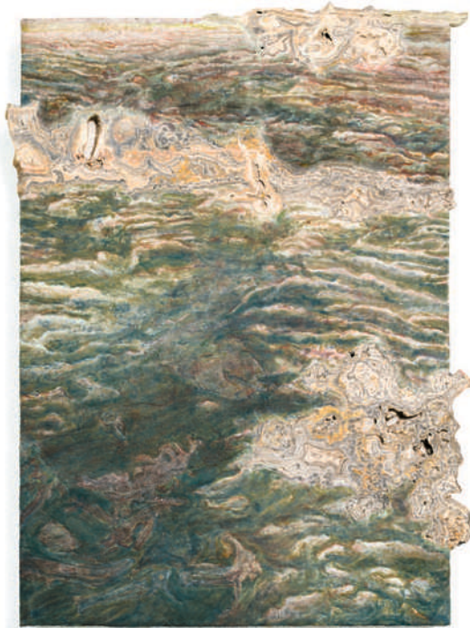
Surface to Air VI (Tartaruga/Afternoon) , 2023, peinture à fresque, intonaco sur aerolam, marbre Tartaruga, 50 × 38 × 4.8 cm