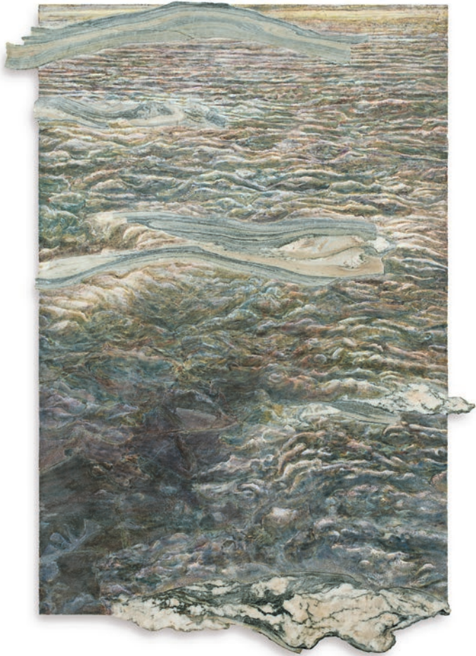
Surface to Air VII (Cipollino/Afternoon Slightly After) , 2023, peinture à fresque, intonaco sur aerolam, marbre Cipollino, 129 × 91.8 × 5 cm