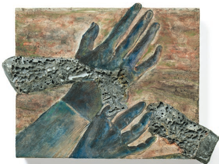
Legenda Aurea Inversa (VII, fragment 3) , 2023, peinture à fresque, intonaco sur aerolam, marbre Bardiglio, 25.8 × 18 × 5 cm