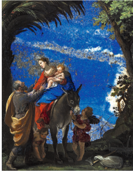
Fig. 5 Jacques Stella , Le Repos pendant la Fuite en Égypte , vers 1629/30, huile sur lapis-lazuli et sur schiste, Pajelu Collection

Un autre exemple : Johann König (1586–1642) [ Fig. 6 ] utilise les textures nuageuses d'une plaque d'agate pour représenter la mer Rouge qui, dans le récit biblique, se retire miraculeusement devant les Israélites avant de noyer leurs poursuivants, les soldats de Pharaon.