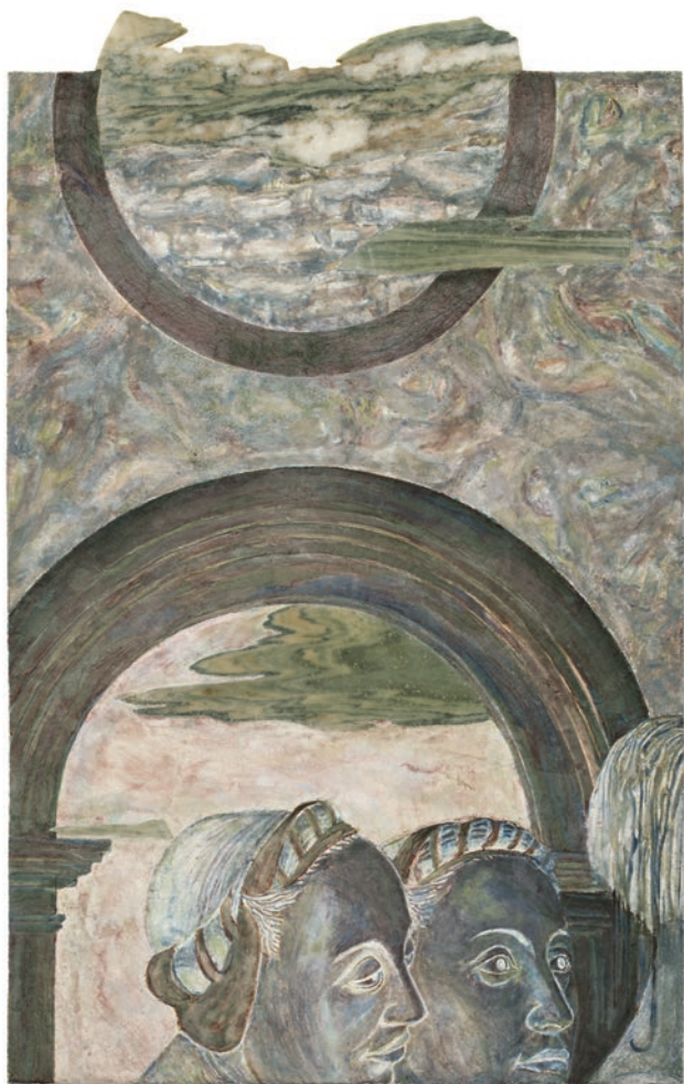
Legenda Aurea Inversa (VII, fragment 2) , 2023, peinture à fresque, intonaco sur aerolam, marbre Cipollino, 63 × 40 × 4.8 cm