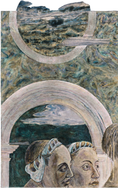
Fig. 1 Image en négatif de Legenda Aurea Inversa (VII, fragment 2), 2023, d'Anri Sala