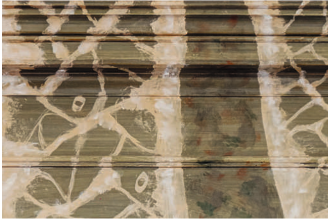
Fig. 4 Alladorf , St-Nicolas, buffet d'orgue (détail), 13 ème siècle, huile sur bois © Reinhold Möller

Sala fait ainsi appel à un geste artistique qui a une longue tradition ; on pourrait le qualifier de citation inversée : Rodin réalise une Porte de l'enfer en bronze, car son contraire, une Porte du paradis dans le même médium, est déjà célèbre à Florence : les portes du baptistère créées par Lorenzo Ghiberti. Le douanier Rousseau se représente dans la pose de Gilles , une icône d'Antoine Watteau, tout de noir vêtu, car le Gilles lui-même brille déjà d'un blanc immaculé au Louvre. Et ainsi de suite.