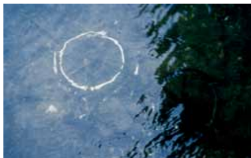
Current (1999), programmierte Folge von fünf 35mm Diapositiven, ohne Ton, 10 Min., Endlosprojektion