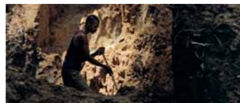
Gravesend (2007), 35mm Farbfilm, übertragen auf HD-Digitalformat, mit Ton, 17 Min. 58 Sek.