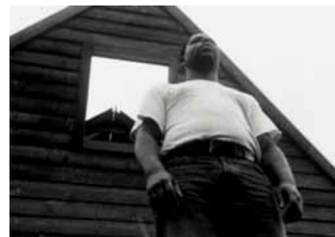
Deadpan (1997), 16mm Schwarz-Weiss-Film, übertragen auf Video, ohne Ton, 4 Min. 35 Sek., Endlosprojektion

STEVE McQUEEN (geboren 1969 in London) gilt als einer der vielseitigsten Künstler der Gegenwart. Zum ersten Mal werden im Schaulager über zwanzig seiner Video- und Filminstallationen sowie Fotoarbeiten und weitere Werke in einer grossangelegten Übersichtsschau vereint. Auch Steve McQueens viel beachtete Kinofilme Hunger und Shame werden als Teil des Begleitprogramms im Schaulager gezeigt.