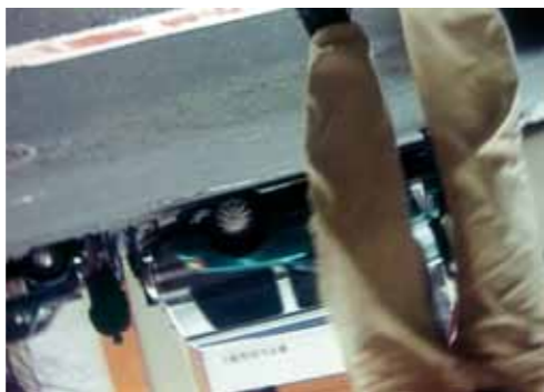
Drumroll (1998), Dreikanal-Farbvideoprojektion mit Ton, 22 Min. 1 Sek., synchronisierte Endlosprojektion