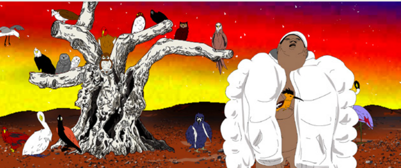
My birds... trash... the future, 2004