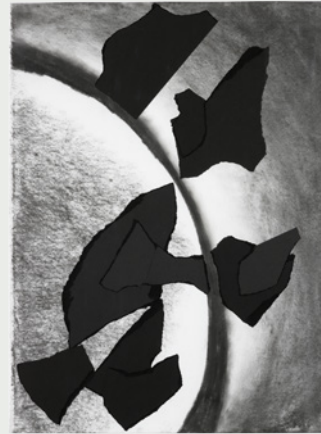
Leftover (for 6th Eight), 2007