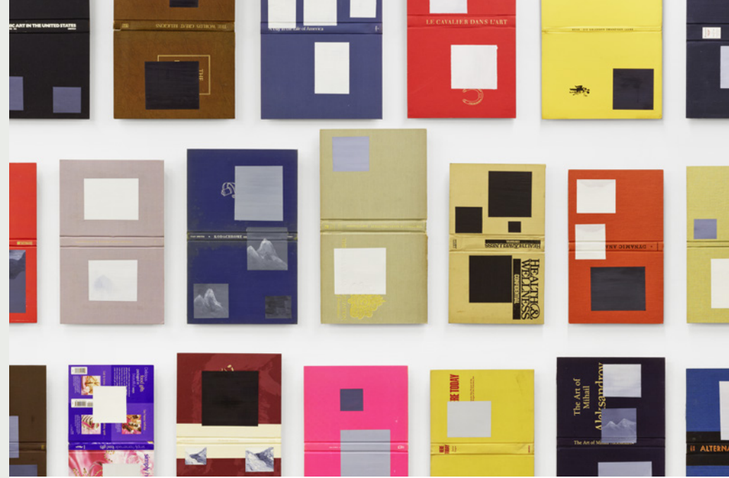
Volumes, (detail), 2012

Joan of Arc was the first to achieve the insight that aesthetic comportment is free from immediate desire. She stole art from that greedy sort of philistinism that masquerades as aestheticism: the sort that wants to caress it or fondle it.